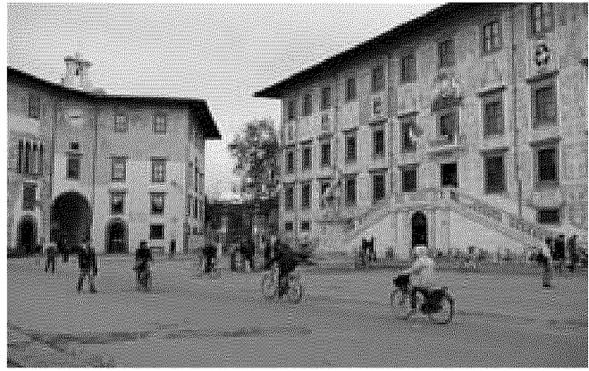
Normale Piazza dei Cavalieri a Pisa, sede della Scuola